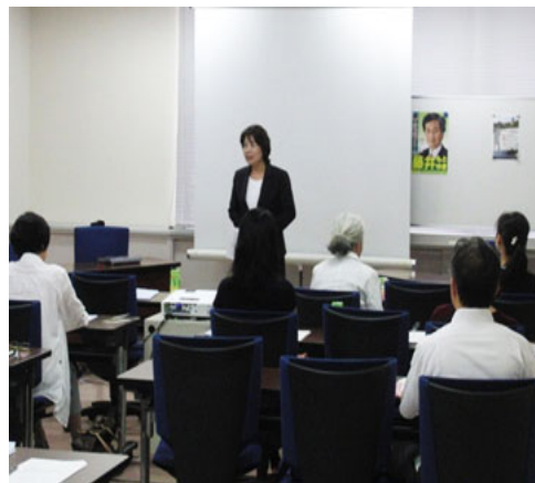
「講演 3」 受講風景