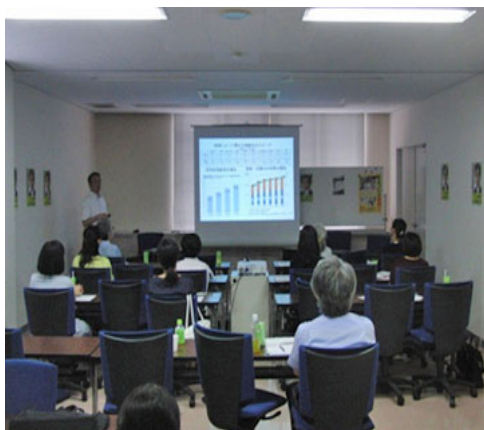
「講演 2」 受講風景